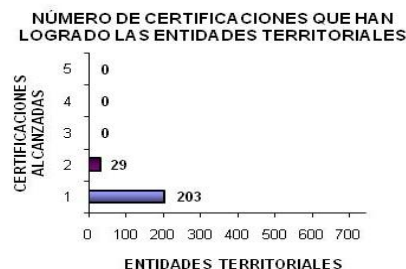
Gráfico: Dirección de Regalías (con información de las entidades certificadoras).

Finalmente, de las 31 entidades territoriales que concentraron el 80 por ciento (6,5 billones de pesos) de los recursos en el periodo 2005 – 2007, tan sólo cinco entidades territoriales (La Guajira, Boyacá, Chiriguana-Cesar, Puerto Boyacá-Boyacá y Puerto Gaitán-Meta) cuentan con certificación de coberturas en régimen subsidiado en salud para la población vulnerable y 10 entidades (Aguazul-Casanare, Córdoba, Cartagena-Bolívar, Antioquia, Castilla La Nueva-Meta, Montelíbano-Córdoba, Tauramena-Casanare, Acacías-Meta, Barrancabermeja-Santander y Villavicencio- Meta) cuentan con cobertura mínima en educación básica. Ninguna de estas entidades cumple con los requisitos establecidos para la certificación de cobertura mínimas en mortalidad infantil, agua potable y alcantarillado.