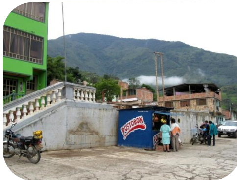
Espacio en el que el sacerdote del municipio de Quetame-Cundinamarca, oficia las misas.

En un foro de Auditoría Visible, organizado por la Dirección de Regalías en el que participaron 200 de los beneficiarios del programa de reconstrucción, la Fundación Compartir, contratista encargado de la ejecución del proyecto, el Fondo de Desarrollo de Proyectos de Cundinamarca gestor del mismo y la Administración del Departamento se comprometieron a concluir las obras en diciembre próximo.