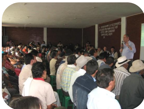
Foto. Rodrigo Torres - comunicaciones IAF Grupo C. Auditoría Visible en el municipio de Quetame, departamento de Cundinamarca.

El proyecto de reconstrucción de las viviendas de Quetame fue viabilizado por la Financiera de Desarrollo Territorial, Findeter, a quien el Ministerio de Ambiente le designó dicha labor; y contó con la participación de la caja de compensación familiar Colsubsidio que otorgó 2.400 millones de pesos en subsidios de vivienda para afectados por el movimiento telúrico, incluso sin estar afiliados a ella.