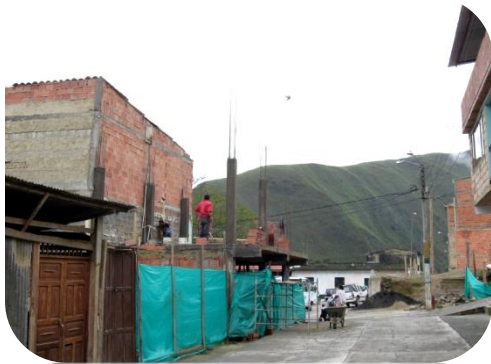
Foto. Rodrigo Torres - comunicaciones IAF Grupo C. Reconstrucción de las viviendas en el municipio de Quetame, departamento de Cundinamarca.

Con recursos del Fondo Nacional de Regalías por 4.034 millones de pesos se realizará la reconstrucción y reubicación de las viviendas afectadas por el sismo de magnitud 7.6 en escala de Richter, en el municipio de Quetame, Cundinamarca.