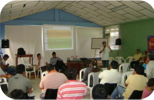
Auditoría Visible en el municipio de Paz de Ariporo en el departamento de Casanare.

La administración del municipio de Paz de Ariporo en Casanare busca desde 2004 una solución definitiva a las constantes inundaciones que sufren sus habitantes en época de invierno, pero por presuntas fallas en la planeación, el proyecto de construcción del alcantarillado pluvial no ha sido terminado y sus costos se han elevado de 26.000 millones de pesos a 36.453 millones de pesos.