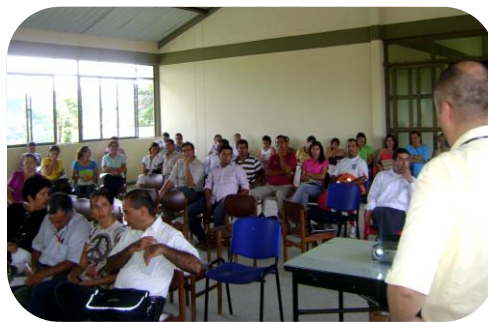
Auditoría Visible en Tauramena - Casanare.

En total fueron comprados y entregados a las instituciones educativas 440 elementos dentro de los cuales se encuentran computadores, proyectores, televisores, reproductores de DVD, videocámaras, minicomponentes y grabadoras, entre otros.