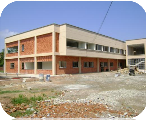
Panorámica externa del Hospital de Chiriguaná en el departamento del Cesar.

Tendrá 101 camas para atención de los pobladores de la región, Unidad de Cuidados Intensivos, cuartos aislados para pacientes críticos, planta propia de tratamiento de agua y sistema especializado de aire acondicionado para evitar contagio de enfermedades.