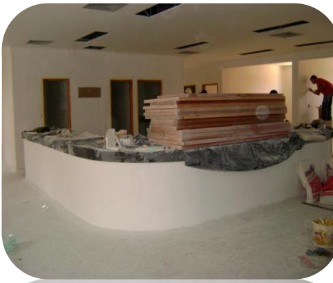
Adecuaciones internas del Hospital de Chiriguaná en el departamento del Cesar.

Según lo explicó la administración del hospital, se llegó a un principio de acuerdo para firmar nuevas escrituras, cuyos gastos correrán por cuenta de cada uno de sus dueños quienes cedieron parte de sus terrenos para la terminación de las obras del centro asistencial.